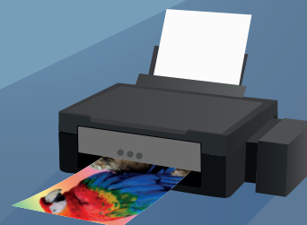
PRINTER CU JET LASER 300-400 WAȚI